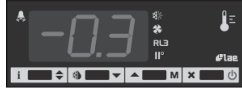
ŞEKİL 1 — Ön panel